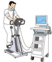
自転車エルゴメータを用いた呼気ガス分析 (運動負荷機器)