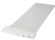
睡眠計 スリープスキャンクラスI(一般医療機器) (株式会社タニタ製)